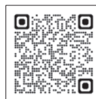
（申込二次元コード）