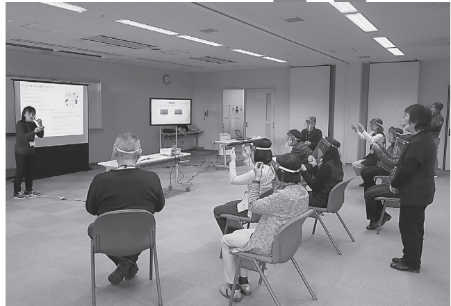
手話奉仕員養成講座（基礎課程）の様子

受講生から「手話講座では、多くの学びや気づきがありました。毎回、手話の上達に一喜一憂しながらも、他の受講生の皆さまとも仲良く一緒に楽しく学ぶことができ、大変有意義な時間を過ごすことができました。とっさの時でも、ろう者の方の役に立てるよう、また手話の輪が広がり、当たり前コミュニケーションができる地域になればと願い、これからも手話の学習を続けていきたいと思っております。」と感想をいただきました。