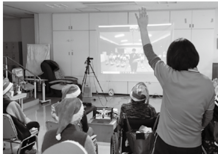
ゆうあいデイサービス