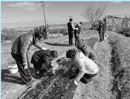
玉ねぎ・イチゴにマルチを敷きました