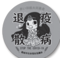
アマビエ蓮花ちゃんバッジ

赤い羽根共同募金は、地域の福祉活動をはじめとし、様々な活動に役立てられています。皆さまのご協力よろしくお祈りします。