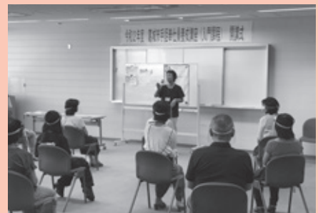
葛城市手話奉仕員養成講座の様子

ゆうあい通信の発行には、葛城市社協会費と赤い羽根共同募金の一部が活用されています。